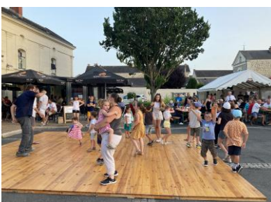
La fête de la musique place de l'Ormeau