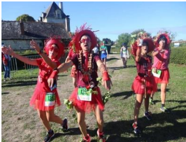
Foulées du Saumur Champigny

La saison 2022-2023 commence sous les meilleurs auspices avec une très belle 20 ème édition des foulées du Saumur Champigny et une 25 ème édition de la fête des Ifs très réussie. Merci encore aux sourires de nos nombreux bénévoles qui accueillent des visiteurs venus profiter de notre beau paysage viticole. On ne oublierait presque nos vacances sous la chaleur, l'ambiance familiale et festive de la fête de la musique de cette soirée du 17 juin place de l'Ormeau au son des accords de la chorale Vocalisa, de l'Harmonie, de l'orchestre Weekend. Une belle récompense pour les bénévoles du comité des fêtes de Varrains.