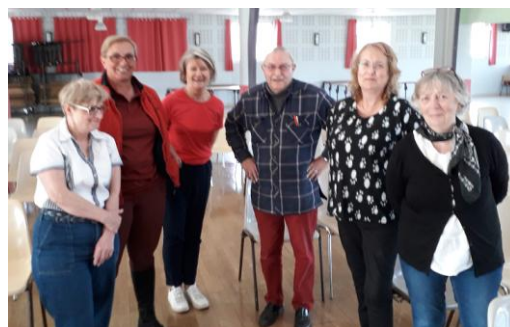
Le conseil d'administration VOCALISA