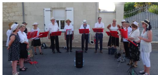
VOCALISA à la fête de la musique Place de l'Ormeau